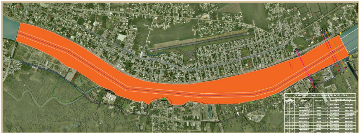
Imagen 2. Vista en Planta del Canal de Navegación Aguas Arriba entre los cadenamientos (5+431 Al 10+460).

Adicionalmente a lo anterior, con topografía se determinarán las secciones transversales del terreno sobre el nivel del río, enlazando dicha topografía con la batimetría del río para ser ligadas con las secciones transversales del canal de navegación. El levantamiento topográfico deberá de realizarse con un escáner laser con vuelo de dron, desde el cadenamiento 5+400 al cadenamiento 10+460 en ambas márgenes del río Pantepec, en donde deberán de entregar lo siguiente;