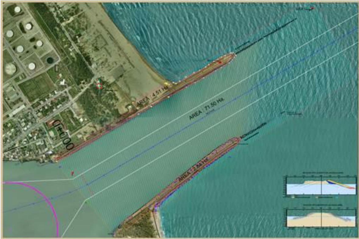
Imagen 3.- Vista en Planta General de la Escolera Norte y Escollera Sur.

CONVOCATORIA A LA INVITACIÓN A CUANDO MENOS TRES PERSONAS DE CARÁCTER NACIONAL No. IO-13-J2X-013J2X002-N-5-2024, LA PRESENTACIÓN Y APERTURA DE LAS PROPOSICIONES MIXTA Y LA EVALUACIÓN DE LA SOLVENCIA DE LAS PROPOSICIONES SE APLICARÁ EL MECANISMO BINARIO.