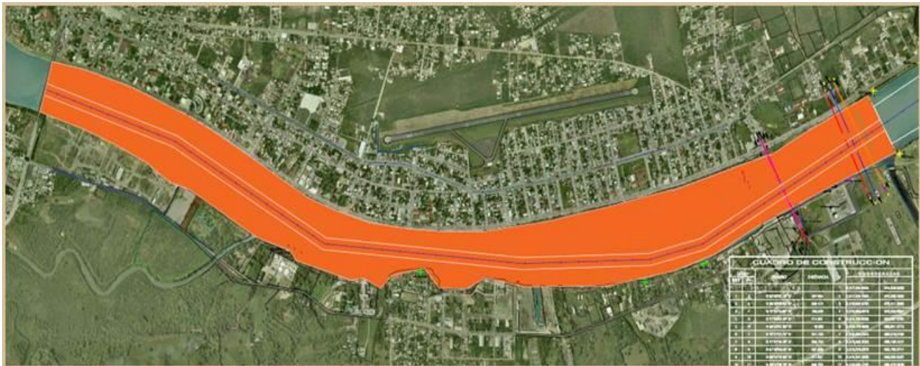
Imagen 2. Vista en Planta del Canal de Navegación Aguas Arriba entre los cadenamientos (5+431 Al 10+460).

Por último, se realizará un levantamiento topobatimétrico empleando los sistemas de ecosonda multihaz , topografía con escáner laser LIDAR de 250 metros de alcance con receptor GPS, cobertura de 360°, equipo GPS topográfico y equipo aéreo no tripulado, para verificar estado actual de la escollera norte y sur para determinar volumetría, en donde deberán de entregar lo siguiente;