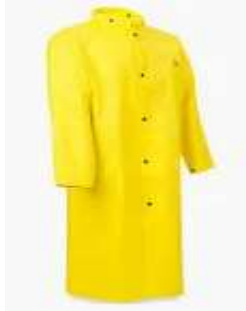
Impermeable color amarillo.