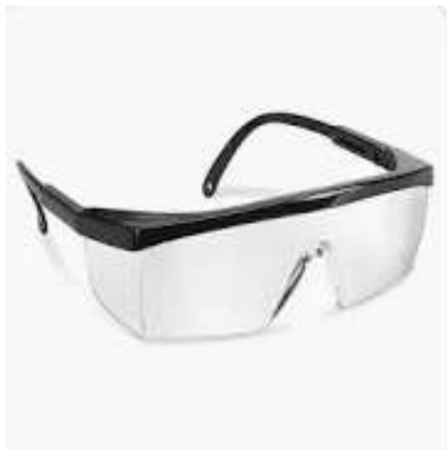
Googles para protección de ojos.