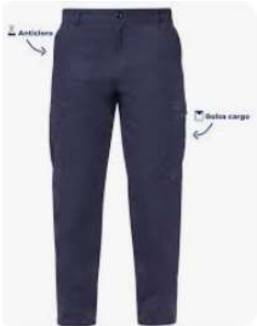
Pantalones sin pinzas color azul marino.