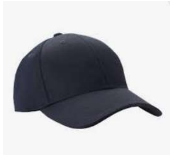
Gorra color azul marino con logotipo oficial de ASIPONA Tuxpan y Código PBIP a los costados.

LOGO DE EMPRESA DE SEGURIDAD (Todos los niveles, a excepción de los Guardias de muelles y bodegas los cuales se les proporcionara el mismo equipo solo que sin logos