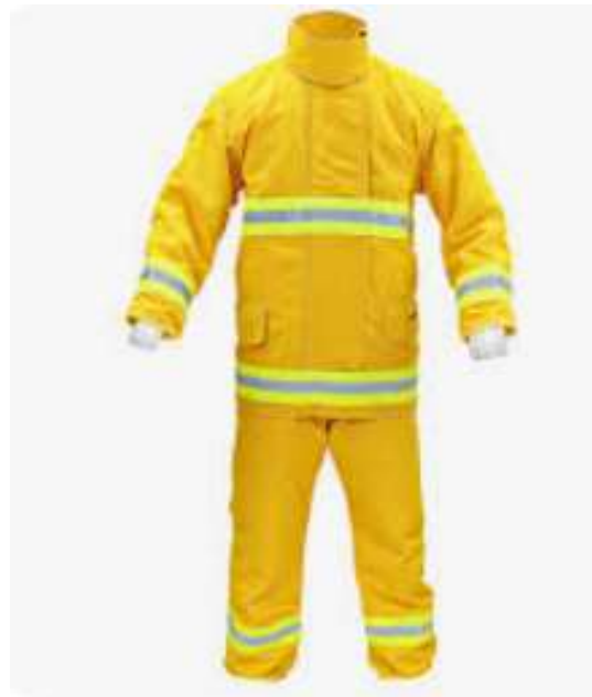
Traje de bombero modelo combat 911 básico.