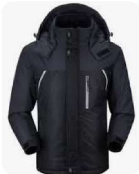
Chamarra con capucha, material impermeable, color negro.