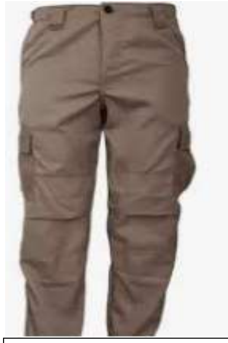
Pantalones sin pinzas color beige.