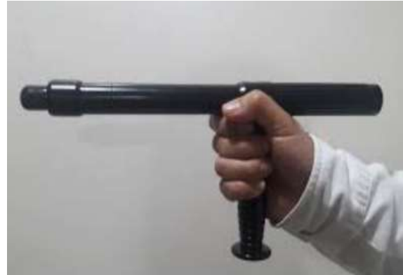
PR 24 expandible o bastón retráctil.