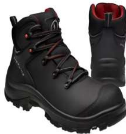
calzado de seguridad diseño ergonómico color negro.