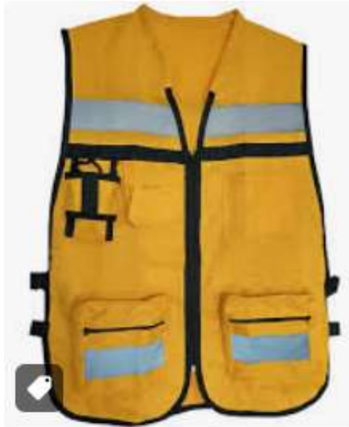
Chaleco con cierre color Amarillo de tela gruesa y bandas reflejantes.