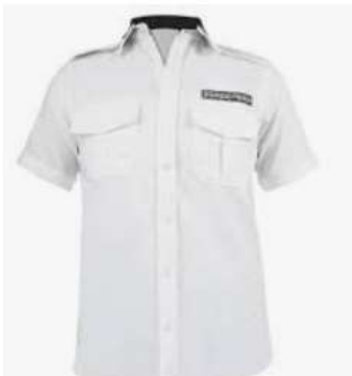
Camisa/blusa manga corta, color blanco.

(Imágenes ilustrativas como referencia, las especificaciones de cada prenda viene incluida en este apartado)