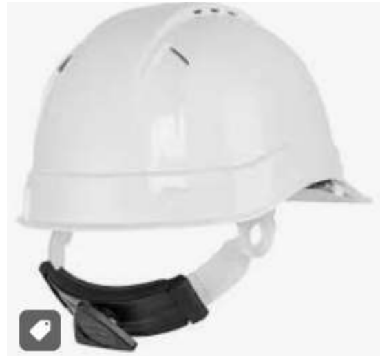
Casco de seguridad blanco con barbiquejo y control de ajuste.