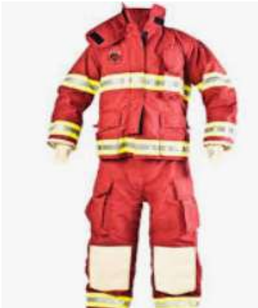
Pantalón y camisa para cada uno de los Bomberos, tela ignifuga color rojo con banda reflejantes en puños y valencianas de pantalón.