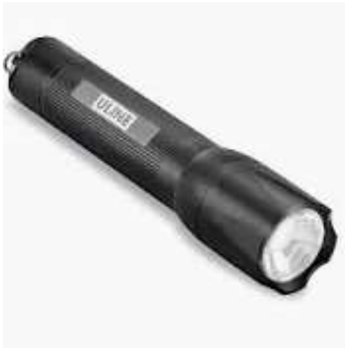
Lámpara de mano de LED con cargador incluido