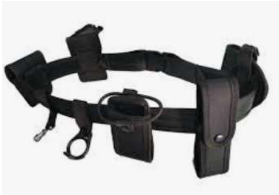
Fornitura con accesorios (portallaves, porta radio, porta bastón retráctil).