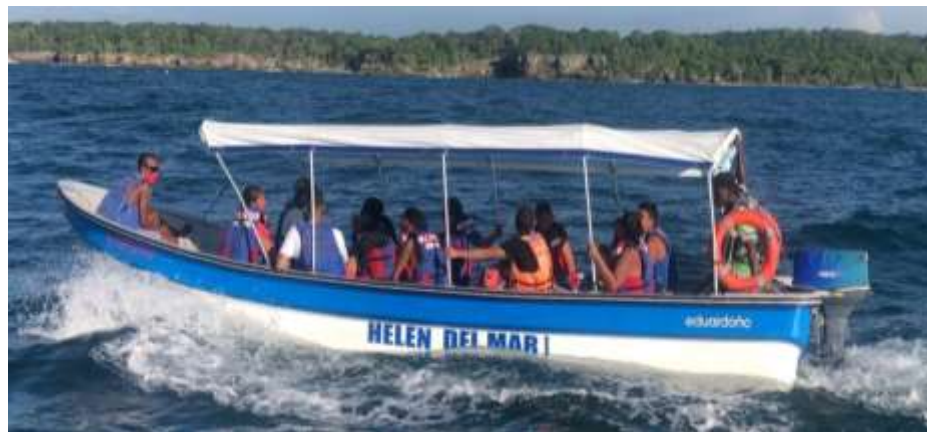
LANCHA PARA 10 PASAJEROS CON TOLDO

La embarcación marítima deberá mantener las siguientes, características con mayor capacidad de carga y de 10 tripulantes a bordo como se muestra en la imagen.