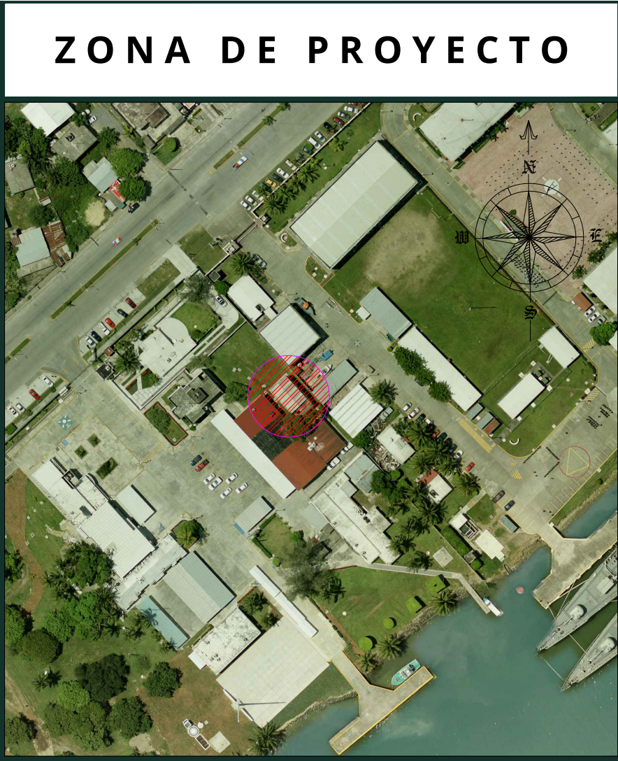
ZONA DE PROYECTO